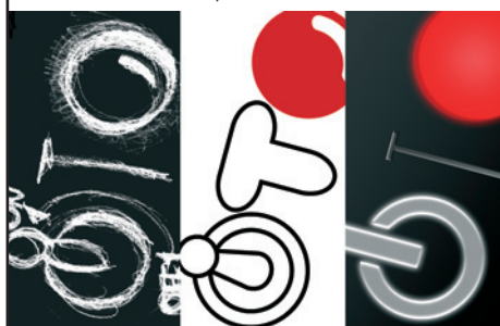
IMMAGINE CHE DIVENTA SOSTANZA DI UN EVENTO, DI UN'AZIENDA, DI UNA STORIA.